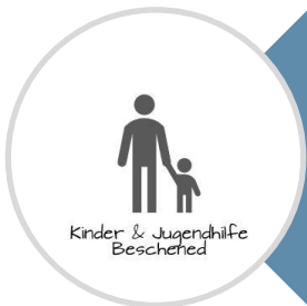
Kinder & Jugendhilfe Besched